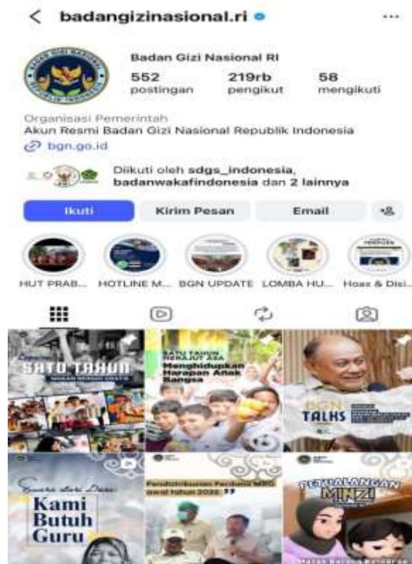
Gambar 5. Akun Resmi Badan Gizi Nasional di Media Sosial sebagai Sumber Informasi Kebijakan MBG

Meskipun narasi resmi pemerintah disajikan secara positif, respons publik di media sosial menunjukkan pola yang terfragmentasi. Fragmentasi ini terlihat jelas dalam kolom komentar unggahan resmi pemerintah mengenai MBG. Sebagian pengguna media sosial menyampaikan dukungan terhadap tujuan program, namun sebagian lainnya mengemukakan kritik, kekecewaan, dan ketidakpercayaan terhadap implementasi kebijakan. Kolom komentar menjadi ruang di mana berbagai pengalaman lokal, persepsi personal, dan kepentingan politik bertemu dan saling berkelindan.