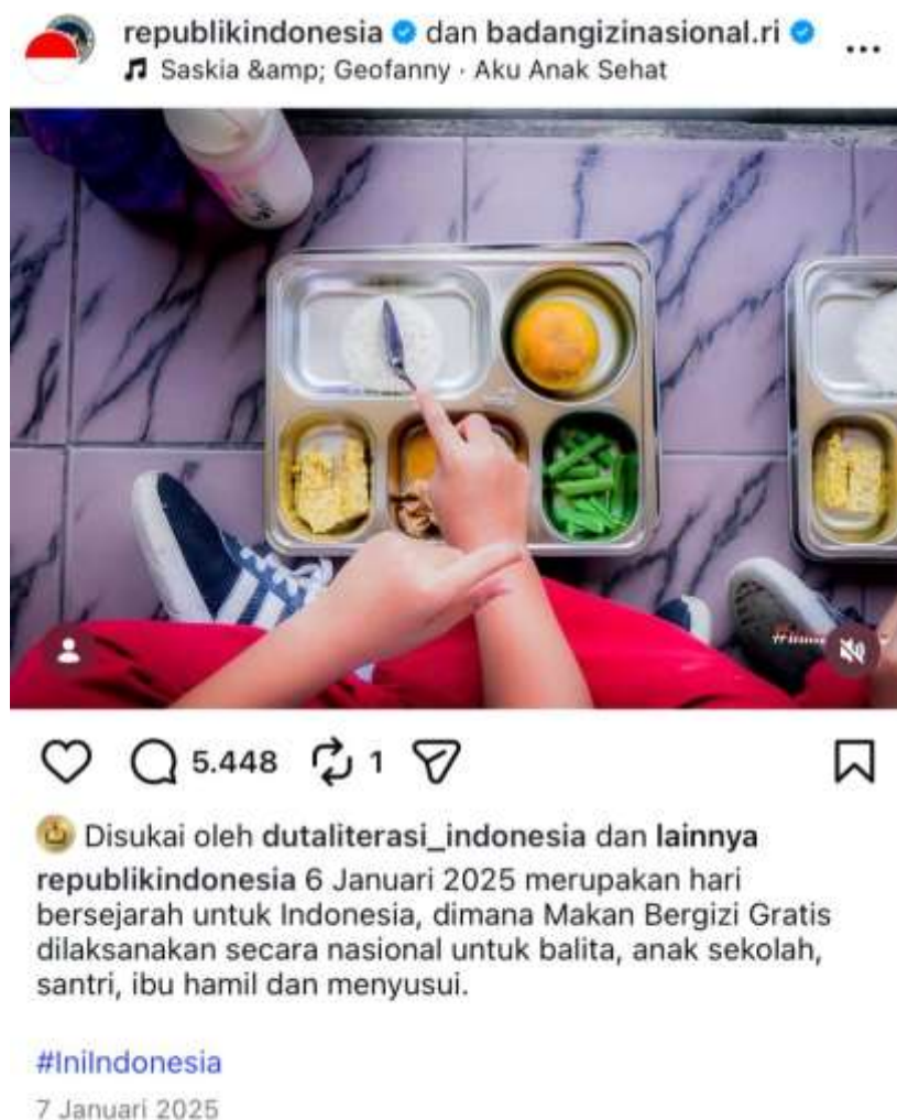
Gambar 2. Postingan Instagram seputar Makan Bergizi Gratis (MBG) Sumber : @republikindonesia dan @badangizinasional.ri, 07 Januari 2025

Namun, keterbukaan media sosial juga membawa konsekuensi terhadap kontrol pesan kebijakan (Hidayat dkk., 2025). Data yang sama dapat ditafsirkan secara berbeda oleh publik, tergantung pada konteks sosial dan preferensi pengguna. Alaimo (2019), menjelaskan bahwa di era media sosial, aktor pemerintah menghadapi tantangan hilangnya kontrol narasi karena pesan kebijakan dapat dengan cepat diproduksi ulang dan dibingkai ulang oleh audiens digital. Dalam konteks MBG, penyebaran data nasional yang masif justru membuka ruang bagi munculnya beragam interpretasi dan perdebatan publik, yang menjadi cikal bakal fragmentasi opini publik di media sosial.