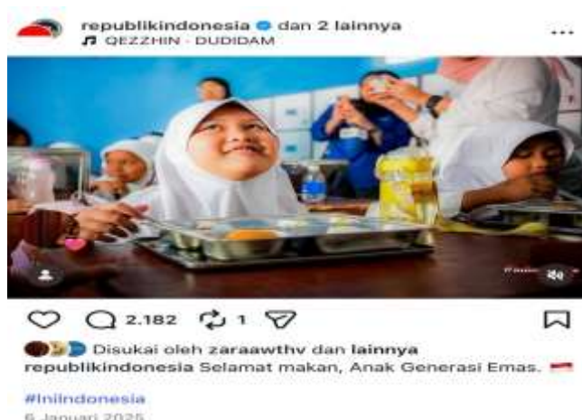
Gambar 3. Unggahan Resmi Pemerintah tentang Pelaksanaan Program Makan Bergizi Gratis

Komunikasi pemerintah mengenai Program Makan Bergizi Gratis (MBG) di media sosial direpresentasikan melalui unggahan visual yang menekankan citra positif program, seperti pemenuhan gizi anak, keberhasilan distribusi makanan, serta perluasan cakupan penerima manfaat (Setyawan dkk., 2025). Akun resmi pemerintah dan lembaga terkait, seperti Badan Gizi Nasional Republik Indonesia, secara konsisten membagikan konten berupa foto makanan bergizi, anak-anak penerima manfaat, serta pernyataan simbolik mengenai pentingnya gizi bagi masa depan bangsa. Strategi visual ini bertujuan membangun asosiasi positif antara MBG dan nilai kesejahteraan, kesehatan, serta kepedulian negara terhadap kelompok rentan.