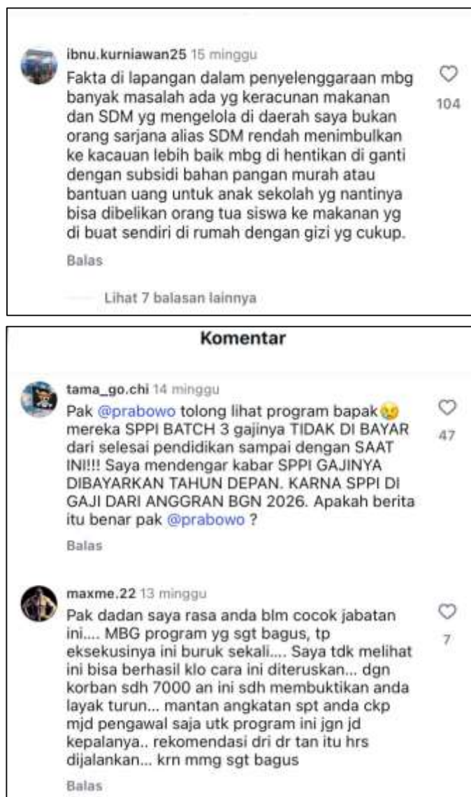
Gambar 4. Contoh Fragmentasi Opini Publik terhadap Program Makan Bergizi Gratis di Media Sosial

komunikasi satu arah dalam menghadapi dinamika opini publik di ruang digital. Media sosial dengan demikian berfungsi sebagai arena diskursus yang mempertemukan narasi resmi negara dengan pengalaman dan emosi publik secara langsung, sehingga menghasilkan fragmentasi opini yang semakin sulit dikelola.